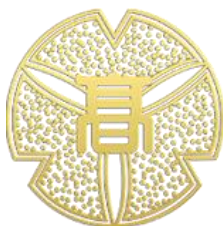
仙台南高校の校章 「英知」「調和」「自律」という 本校の三大教育目標を図案化

本校は昭和52年4月、都市の利便性と穏やかな生活感がほどよく溶け合い、四季の移ろいを身近に感じられる広瀬川のほとりの地、仙台市太白区根岸町に開校しました。校章には、校木である「公孫樹（いちょう）」の葉3枚に、「英知」「調和」「自律」の校訓が込められています。「社会のさまざまな場面において、積極的にリーダーシップを発揮して社会に貢献できる、知・徳・体のバランスが取れた人材を育成すること」をスクール・ミッションとし、「大学そして社会に出てからも主体的に学び続ける力を涵養し、生徒自ら考える場面を提供することで、実践力・総合力を高めていける学校」を目指して、発展を遂げてまいりました。創立以来「総合力は南高で、部活も勉強も団体戦」の標語のもと、文武両道の進学校として、学校全体が一丸となって学業と部活動に取り組んできました。仙台南高校は今年創立50周年を迎えます。半世紀を彩るマスコットキャラクターとロゴマークが本校生徒の発案で誕生しました。