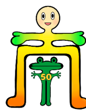
創立50周年記念 ロゴマーク