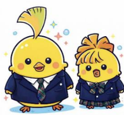
創立50周年記念 マスコットキャラクター いちょうどり兄妹 兄：みなまる 妹：みなっぴ